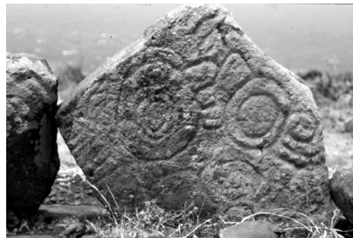
El Calvario de Garaña, La Palma

También es recomendable frotar los grabados. Para ello, necesitará un papel copia o papel offset fino que se deberá extender sobre los grabados con cinta adhesiva Tesakrepp (de papel arrugado); después, puede embellecer y dar cuerpo a los contornos frotando con un puñado de hierba o plantas machacadas.