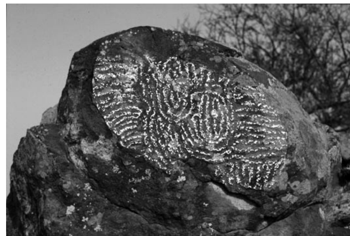
La Pasada, La Palma